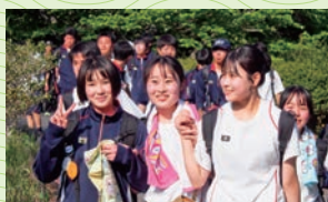
▲仲間とともに歩く萩行路