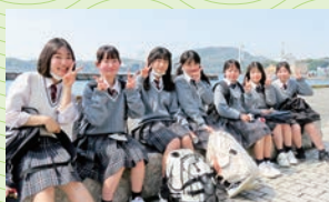
▲テイクフォーツ、今年はどこに行くのかな?