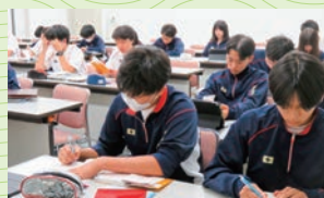
▲実力強化合宿で自分の限界に挑戦!