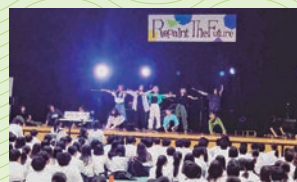
▲慶進祭、全力で盛り上げましょう!